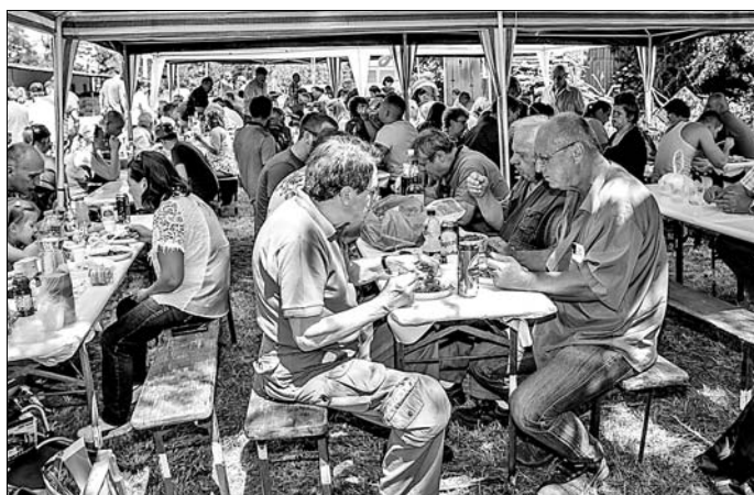
Vadásztalálkozó elképzelhetetlen egy jó ebéd nélkül.