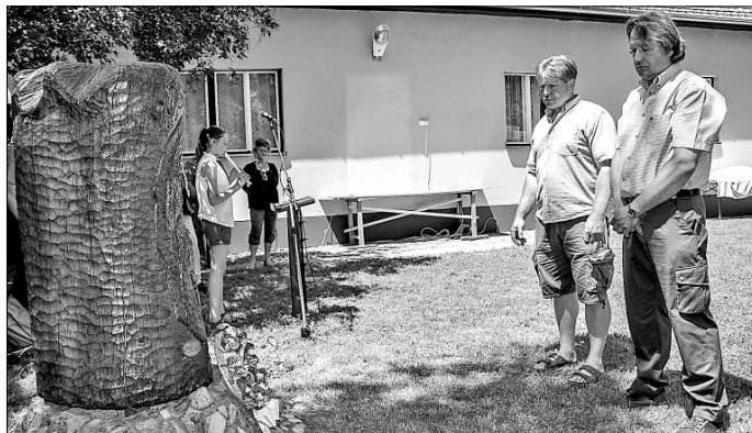
Tisztelgés a névadó emlékműve előtt.