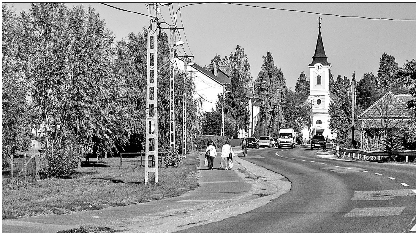
Jövőre felújítják a főút mellett futó gyalogjárdát is.