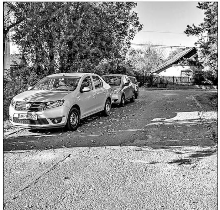
A harangozóházat lebontják, helyén parkoló lesz.