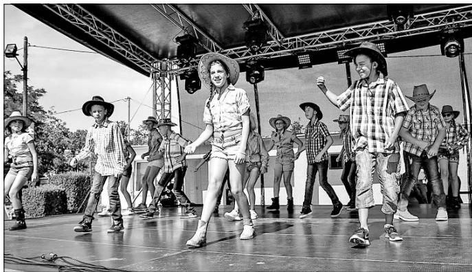
Country-muzsikára táncoltak az ötödikesek.

Szóval tényleg jó hangulat kerekedett a foci pályára alkalmi színpadánál, ám dr. Gyuricza Miklós polgármester rossz hírt