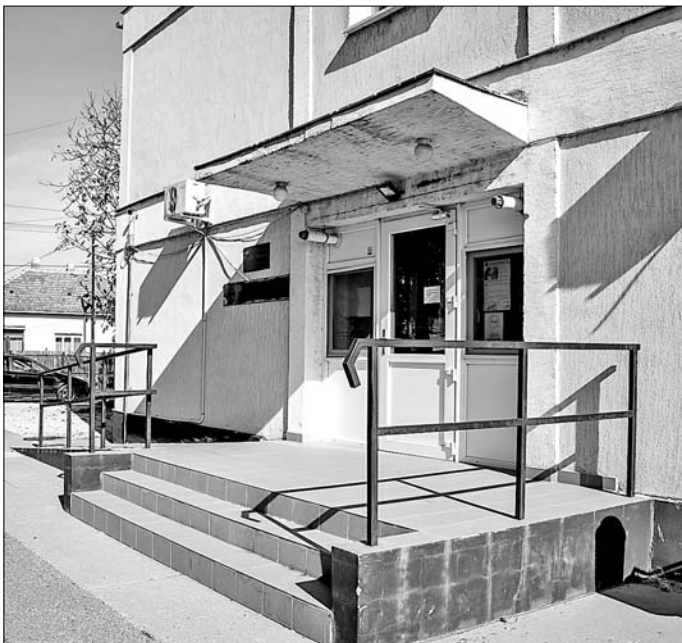
Bővítik az orvosi rendelő épületét. Két helyiségből áll majd a fogorvosi részleg.