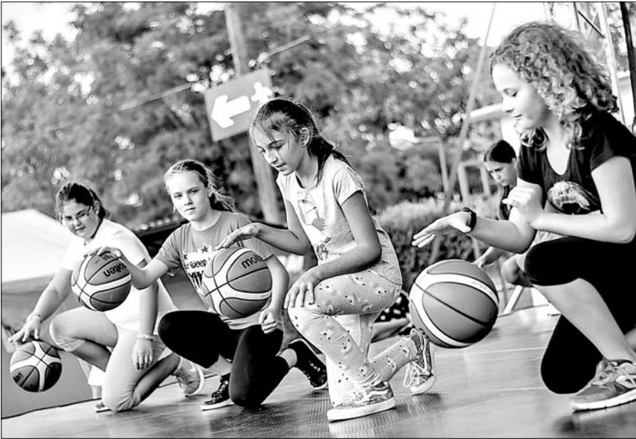
Ritmus, labda, jókedv.