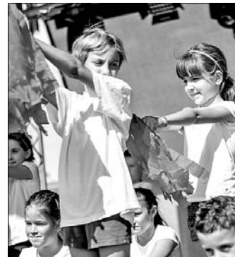
Kicsik a színpadon.

közül is. Igazi bulihangulatot teremtett. A számok között kedélyesen társalgott a közönséggel. Elárulta, hány évesen adta első nagy koncertjét, 42 éves lesz, mikor csókolózott először férjével, amióta még háromszor biztosan, mert ennyi gyermekük született – viccelődött. Megkérdezte, hogy emlékeznek-e rá a tószegiek, hogy eleinte, tizenévesen a piros alapon fehér pöttyös ruha mellett még mit viselt a színpadon, jött a szellemes válasz a közönség soraiból: – Bugyit! Természetesen azt is,