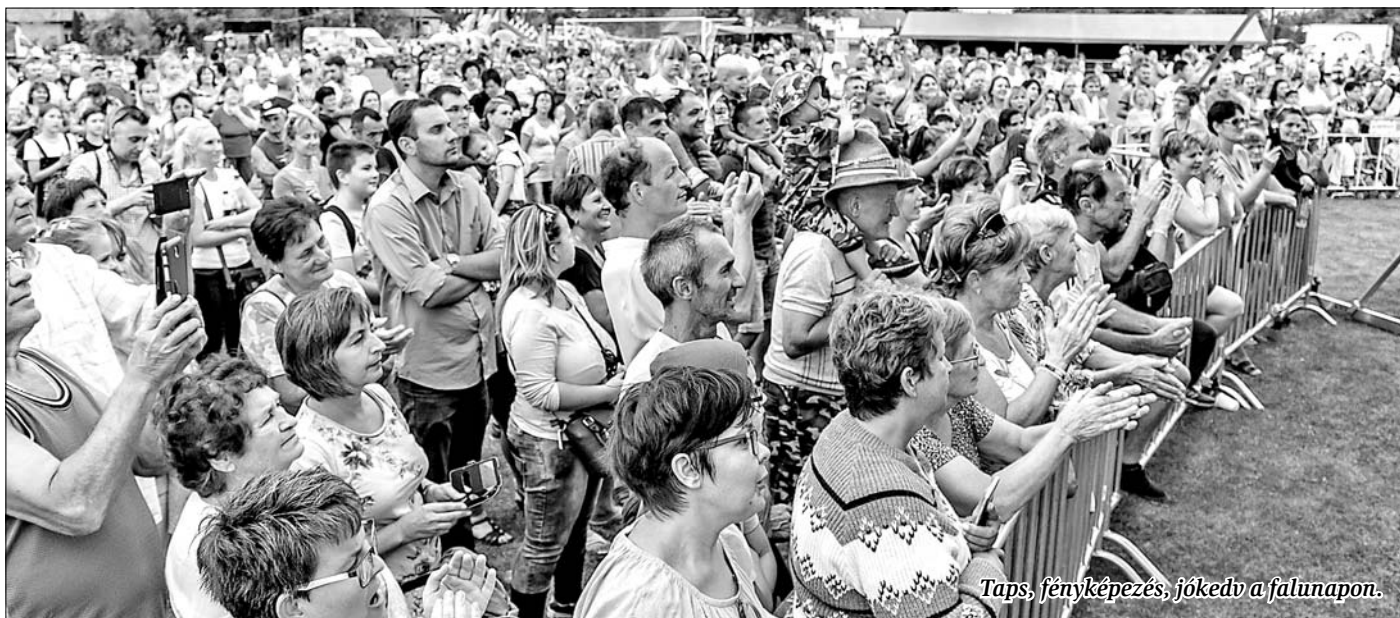
Taps, fényképezés, jókedv a falunapon.