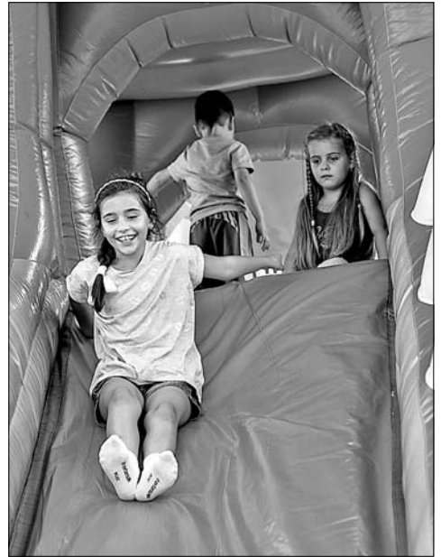
Ujjé, a csúszdán jaj de jó!