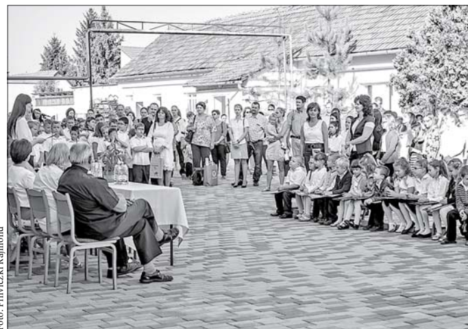
Az önkormányzat közel 30 millió forintból újjátotta fel az általános iskolát. A tanévnyitót már a megszépült iskolaudvaron tartották. Háttérben az újonnan kialakított ebédlő.