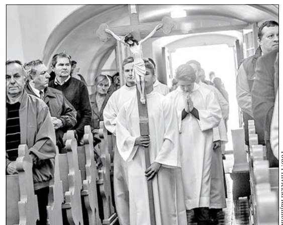
Szent Mihály napi ünnepi misét tartottak a tószegi katolikus templomban, amelyet körmenet követett.