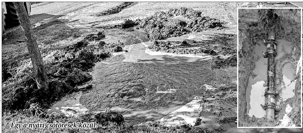
Egy a nyári csőtörések közül.

elavultsága gyakorlatilag országos probléma, és nemcsak Tószegen, hanem a teljes ellátási területükön sok a csőtörés, és szükség lenne szinte minden településen a hálózat felújítására. Partnerek abban, hogy megfelelő pályázati lehetőség esetén az önkormányzattal közösen megvalósulhasson ez a beruházás.