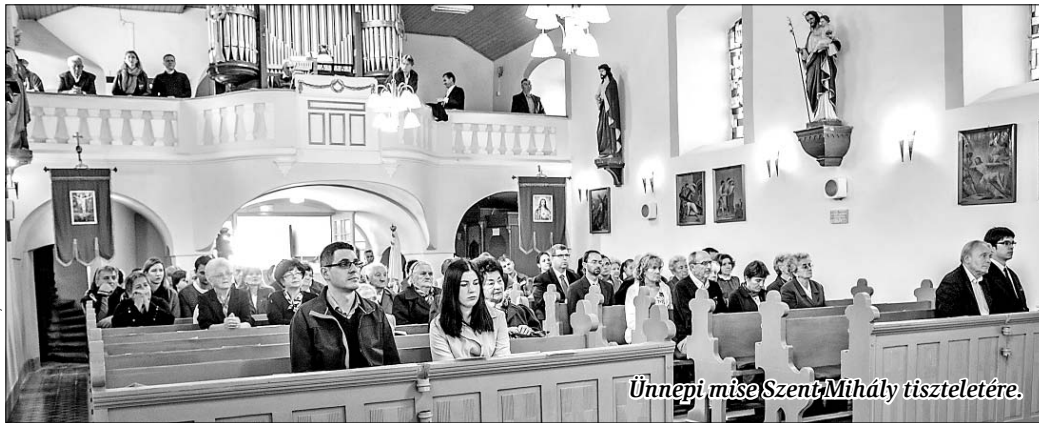
Ünnepi mise Szent Mihály tiszteletére.