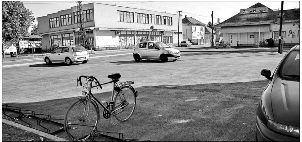
Az önkormányzati parkolót az idén újították fel.

– Volt, van és lesz is. Hogy ne menjünk messzire az iskolából, a tornaterem tetőszigetelését és nyílászáró cseréit tavaly nyáron végeztük el. Nagyon fontos fejlesztés ez is, hiszen az épület már annyira beázott, hogy balesetveszélyes volt annak