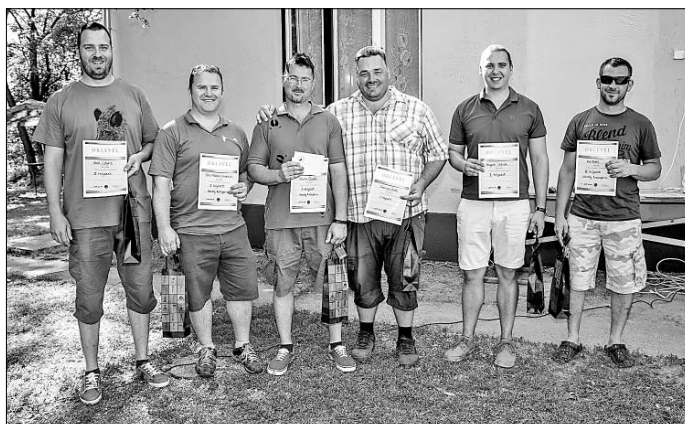
Akik jeleskedtek a rendezvényen.

moltak össze a vadásznapon. A rendezők örültek, hogy sokan eljöttek. Ezzel a nappal azoknak is szerettek volna köszönetet mondani, akik támogatják a társaság életét és hozzájárulnak a sikeres működéshez!