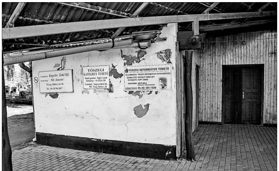
Időszerű egy új ravatalozó felépítése.

– A 2016. évi pénzmaradvány felosztását tárgyaló képviselő-testületi ülésen valóban javaslatot tettem egy új ravatalozó felépítésére is. A jelenleg használatban lévő épület már annyira rossz állapotú, hogy szinte csak az isteni gondviselésnek köszönhető, hogy eddig még nem dőlt össze. Régóta fennálló, nagyon égető probléma ez is a településen, melyre eddig nem sikerült forrást szerezni. Sajnos olyan pályázat, melyen e célból sikeresen indulhatnák, továbbra sem várható, ezért saját forrásból kell biztosítanunk az ehhez szükséges fedezetet. Az elmúlt tíz év felelős gazdálkodásának köszönhetően, ma már ez a pénz is rendelkezésünkre áll a költségvetésünkben.