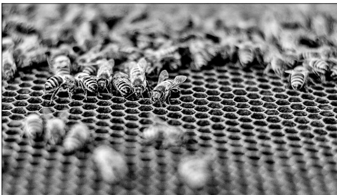
Egy-egy kaptárnak több tízezer lakója van