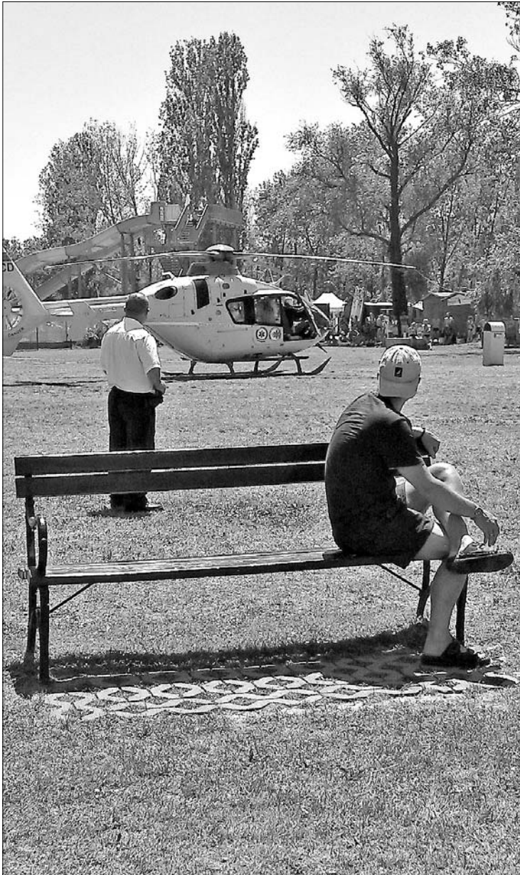
Mentőhelikopterrel szállították kórházba a fuldokló férfit.

Fuldokló embernek segítettek testvérével